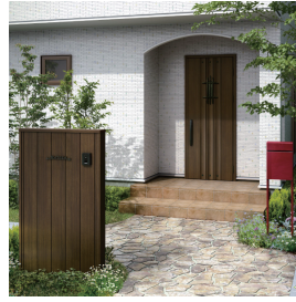
ポスト：フィット シックレッド 機能ボール：ルシアス フェール 04型 / ショコラウォールナット 玄関ドア：スマートドア ヴェナート M02 / ショコラウォールナット