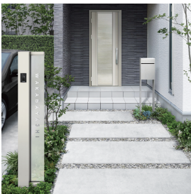
機能ボール：ルシアス ポストユニット BS01型 / 桑炭 玄関ドア：スマートドア ヴェナート S13 / 桑炭