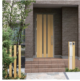
機能ボール：ルシアス ポストユニット BS02型 / ハニートレー 玄関ドア：スマートドア ヴェナート S20 / ハニートレー