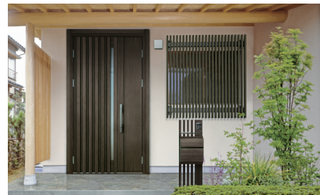
機能ボール：ルシアス ポストユニットAS02型 / 桑炭 玄関ドア：スマートドア ヴェナートM04 / 桑炭

たて格子を活かしたデザインや濃い木調カラーなどを組み合わせることで、和の雰囲気を感じ出すことができます。