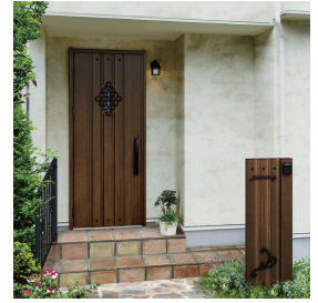
機能ボール：ルシアス ポストユニット AM01型 / ショコラウォールナット 玄関ドア：スマートドア ヴェナート M07 / ショコラウォールナット

アルミやクリアパネルなどの素材を活かしたデザインで統一するとアプローチ空間がシャープな印象にまとまります。