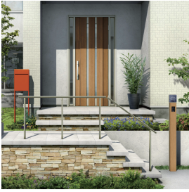
ポスト：フィット シルバー 機能ボール：ルシアス サインボール A01型 / フラチナステン 玄関ドア：スマートドア ヴェナート P04 / フラチナステン