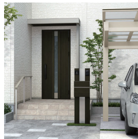
機能ボール：ルシアス ポストユニット BS01型 / 桑炭 玄関ドア：スマートドア ヴェナート S13 / 桑炭

ヨーロッパの街灯を思わせる鋳物をあしらったデザインや暖色系のカラーがおすすめです。