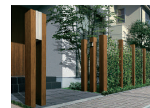
アクセントポール